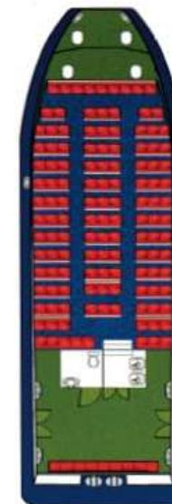
della stessa serie: Catamarano FOSCOLO